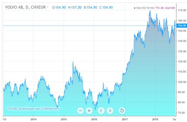
Action AB VOLVO sur 5 ans http://www.strategie-bourse.com/

Notre site: http://ugict-rt.reference-syndicale.fr Nous écrire: Org-Syndicale.cgt-Vx@renault-trucks.com