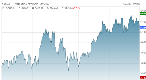
CAC 40 sur 5 ans http://www.abcbourse.com/